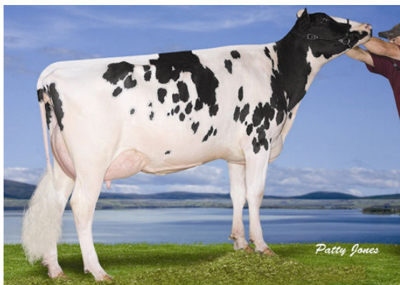
MISTY SPRINGS SHOTTLE SATIN